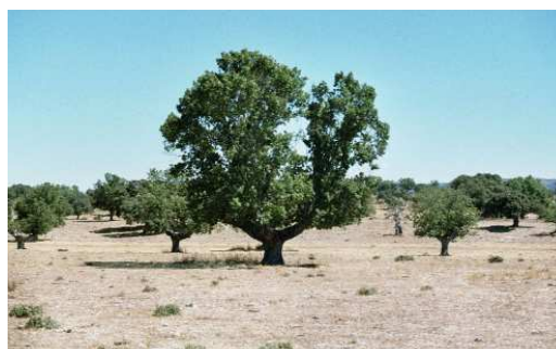
FIGURA 2. Paisaje adeshado donde se recolectó Phymatodermis lividus .

Método empleado: El ejemplar fue capturado a las 6 de la tarde sobre ramas muy pequeñas de Populus , cortadas y amontonadas junto a otras de Ulmus (Fig. 5). Se encontraba en posición de reposo con la cabeza hacia arriba y perpendicular respecto del suelo, en la parte sombría, seguramente esperando las últimas horas del atardecer para entrar en actividad (Iablokoff, 1950). Al intentar capturarlo, el insecto se dejó caer, mostrando un comportamiento similar al de