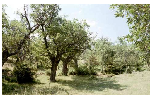
FIGURA 3. Hábitat de Clytus tropicus en el cual se capturaron los dos ejemplares.