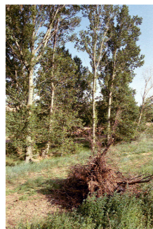
FIGURA 5. Lugar donde se realizó la captura de Lopezcolonia punctata .