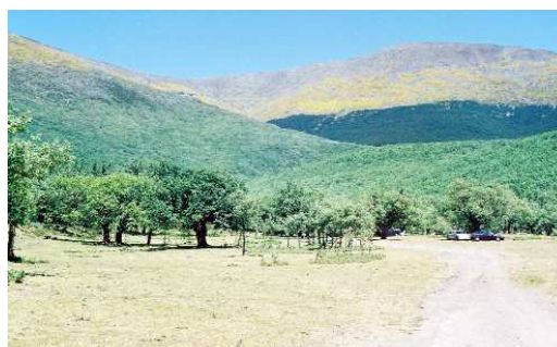
FIGURA 4. Comienzos de las estribaciones de la Sierra del Moncayo, donde se capturó Grammoptera abdominalis .